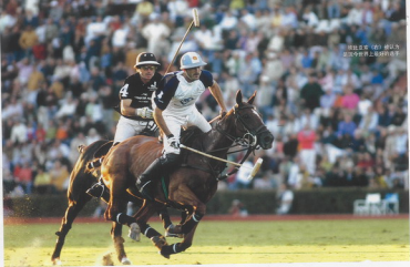
职业选手“射门”被认为是马球运动中最高级的选手