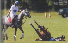
本图：马球是一项对技术和体能要求很高的运动，往往只有少数人能够成为职业马球运动员

拥有两名10球选手和两名2球选手(总分即24)，同时，他们和一个由4名5球选手组成的团队(总分为20分)比赛，则第一